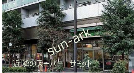
近隣のスーパー サミット